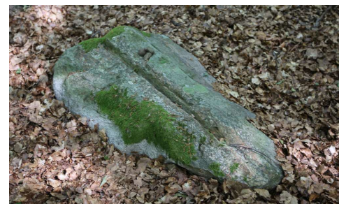
Rillesten fra Lille Hareskov

A Først på vor tur skal vi se på nogle rillesten. De "kloge" diskuterer, om disse riller er lavet for at flække stenene, eller om rillerne har et kultisk formål. Jeg har min mening, som I skal høre om, når vi finder rillestene.